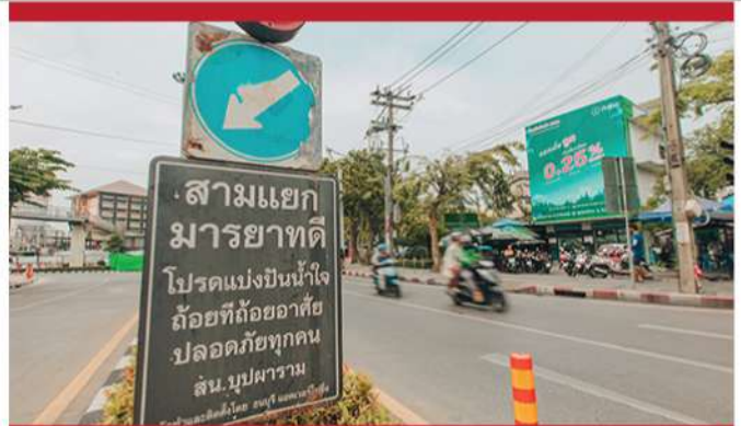
แยกมวยราชตัด : บริเวณแยกหัวถนนสมเด็จพระยาเอกจากถนนประชาธิปไตย เนื่องจากเป็นแยกที่ไม่มีสัญญาณไฟจราจร

สถานที่เหล่านี้แสดงให้เห็นว่า วงเวียนเล็กเป็นพื้นที่ที่ผสมผสานระหว่างประวัติศาสตร์และชีวิตประจำวันของชุมชนดั้งเดิม ซึ่งมีลักษณะเป็นตลาดและย่านที่พักอาศัยที่เต็มไปด้วยเรื่องราว