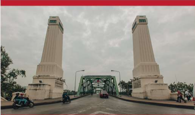
สะพานพระพรหมยอดฟ้า (สะพานพรหม) : วงเวียนเล็กตั้งอยู่ใกล้กับทางขึ้น-ลงสะพานพรหม ทำให้เป็นจุดเชื่อมต่อสำคัญที่นำไปสู่ฝั่งพระนคร