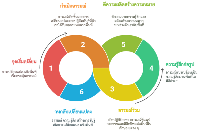
ภาพที่ 2 รูปแบบการวิเคราะห์อารมณ์และความรู้สึกผ่านแนวคิดทางภูมิศาสตร์

ดังนั้นจากวงจรที่ผู้เขียนได้ลองเสนอนี้จึงอยู่บนความเป็นไปได้ของการนำเอาแนวคิดทางภูมิศาสตร์มนุษย์มาเป็นฐานในการออกแบบการวิเคราะห์พื้นที่ อารมณ์ และความรู้สึก ดังนั้นเพื่อสร้างความเข้าใจมากขึ้น จึงขอนำรูปแบบการวิเคราะห์อารมณ์และความรู้สึกผ่านแนวคิดทางภูมิศาสตร์ (ภาพที่ 2) มาเป็นแกนในการอธิบายตัวอย่างปรากฏการณ์หนึ่งที่เกี่ยวข้องกับการพัฒนาพื้นที่ริมน้ำในเมือง (อาจตรงกับความเป็นจริงหรือเสริมสถานการณ์เพื่อให้เกิดความเข้าใจซึ่งเป็นเพียงแนวทางหนึ่งเท่านั้น) ดังนี้