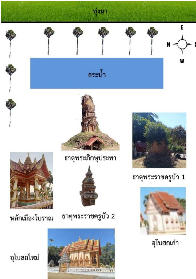
ภาพที่ 4 แผนผังที่ตั้งของธาตุโบราณภายในวัดลุ่มภูรามนิवास