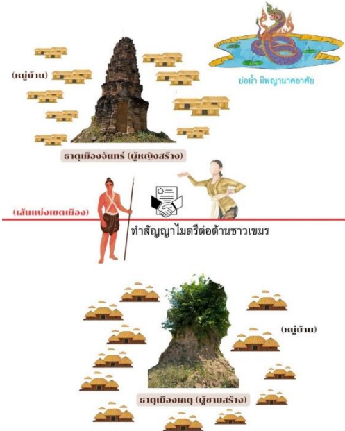
ภาพที่ 5 ธาตุโบราณตามปริมปราศติความสัมพันธ์ระหว่างกลุ่มชน