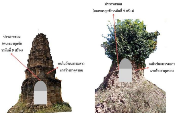
ภาพที่ 6 ธาตุโบราณตามปริมปราศติวิวัฒนาการการสร้างแปงธาตุ (ที่มา : ฉันทพงศ์ สารรัตน์, ธนพล ป้องแก้ว, เอนก ศรีภพ และธีรพัฒน์ ผงกุลา, 2568)