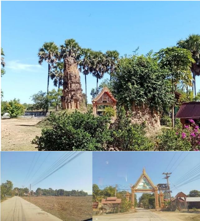
ภาพที่ 1 วัดลำภูรามณิवासกับความเป็นศูนย์กลางชุมชนจากอดีตถึงปัจจุบัน (ที่มา : รัชยพงศ์ สารรัตน์, ธนพล ป้องแก้ว, เอนก ศรีภพ และธีรพัฒน์ ผงกุลลา, 2568)