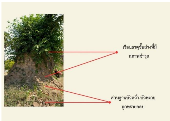
ภาพที่ 3 ธาตุทางทิศตะวันตก