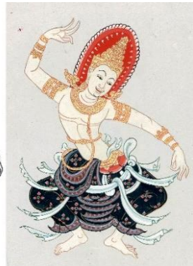
ภาพที่ 13 จิตรกรรมรูปเทวดาล้านนานิยมแบบลังกา