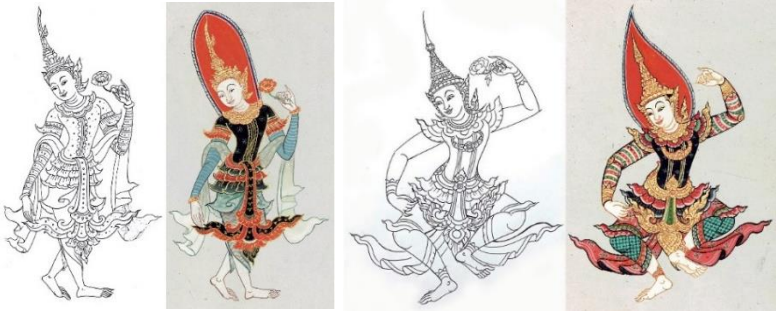
ภาพที่ 14 จิตรกรรมรูปเทวดาล้านนาแบบพม่า