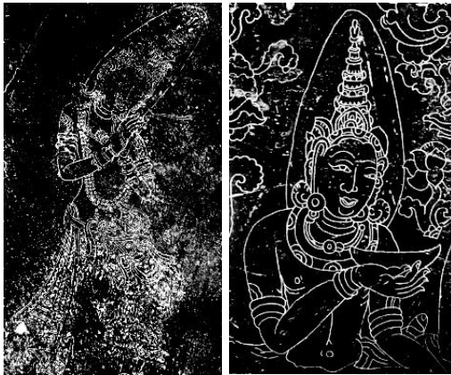
ภาพที่ 4 จิตรกรรมลายเบารูปเทวดา พระพุทธรูปสลักหิน วัดตระพังทอง จังหวัดสุโขทัย (ซ้าย) และรูปพระโพธิสัตว์ ภาพสลักหินวัดศรีชุม จังหวัดสุโขทัย (ขวา)