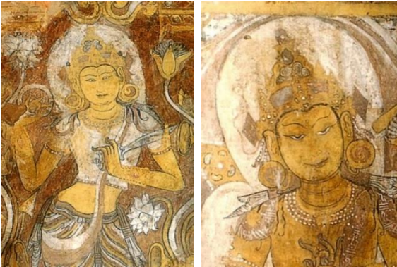
ภาพที่ 1 จิตรกรรมรูปพระโพธิสัตว์ เจดีย์อเพยทนะ

ระยะแรกราวพุทธศตวรรษที่ 14-15 อาณาจักรหริภุญไชย มีความสัมพันธ์ กับกลุ่มบ้านเมืองในแถบที่ราบลุ่มแม่น้ำเจ้าพระยา ดังนั้นศิลปะหริภุญไชยยุคต้น จึงมีอิทธิพลของศิลปะทวารวดีจากภาคกลาง ตลอดจนความสัมพันธ์ทางเชื้อชาติ วัฒนธรรมกับกลุ่มมอญในราวพุทธศตวรรษที่ 16-17 รวมถึงพระพุทธรูปศาสนา แบบหินยานจากเมืองลพบุรี ผสมผสานกับพระพุทธรูปศาสนาเถรวาทแบบลังกา ที่แพร่เข้ามาทางเมืองสุพรรณนครของมอญ และเมืองพุกามของพม่า ด้วยเหตุนี้ ศิลปกรรมของหริภุญไชยจึงได้รับอิทธิพลทั้งจากดินแดนลุ่มแม่น้ำเจ้าพระยา ซึ่งขณะนั้นอยู่ภายใต้อำนาจทางการเมืองวัฒนธรรมของเขมร และได้รับอิทธิพล จากศิลปะพม่าเมืองพุกามซึ่งกำลังเจริญรุ่งเรืองในช่วงเวลานั้น (สุรพล ดำริห์กุล, 2561, น.128-129) และในช่วงพุทธศตวรรษที่ 18 อาณาจักรหริภุญไชยมี ความเจริญรุ่งเรืองทางด้านศิลปกรรม ด้วยระยะเวลาหลายร้อยปีทำให้ศิลปะ หริภุญไชยที่มีพื้นฐานจากศิลปะทวารวดีทางภาคกลางแล้ว ยังผสมผสาน แบบอย่างอีสาน และพุกามตะวันตก (สันติ เล็กสุขุม, 2549, น.19)