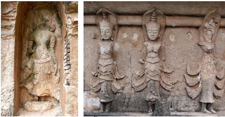
ภาพที่ 6 ประติมากรรมปูนปั้นรูปเทวดา ประดับชุ้มเจดีย์ วัดป่าสัก จังหวัดเชียงราย (ซ้าย) และประติมากรรมรูปเทวดาประดับก้านฉัตรเจดีย์ วัดอุโมงค์สวนพุทธธรรม จังหวัดเชียงใหม่ (ขวา)

ศิลปกรรมรูปเทวดาปูนปั้นภายในชุ้มเจดีย์วัดป่าสัก จังหวัดเชียงราย ซึ่งปรากฏหลักฐานเพียงส่วนวรกายที่อ่อนบนลงมาในลักษณะยื่นห้อยพระกรลงมาข้างลำตัว และพระกรอีกข้างหนึ่งยกขึ้นคล้ายกับประทานพร และก้านฉัตรเจดีย์