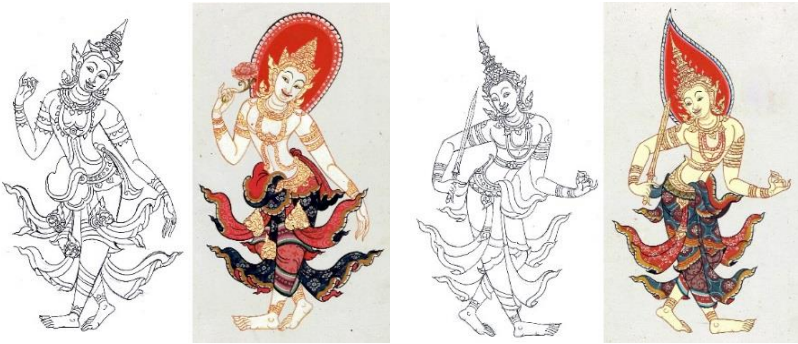
ภาพที่ 15 จิตรกรรมรูปเทวดาล้านนารัตนโกสินทร์

เป็นการสร้างสรรค์จิตรกรรมรูปเทวดา ซึ่งได้แบบอย่างงานศิลปกรรมที่ปรากฏขึ้นยุคหลังของศิลปะล้านนา ได้แรงบันดาลใจจากการศึกษางานศิลปกรรมจิตรกรรมลายทองธรรมมาสน์ วัดพันเตา และทวารบาลประตู่วิหารลายคำ วัดพระสิงห์วรมหาวิหาร จังหวัดเชียงใหม่ ซึ่งแสดงรูปเทวดาอุรยาตหรือการเดินทางตามแบบแผนนาฏลักษณ์ของภาพบุคคลในศิลปะรัตนโกสินทร์ สวมศิราภรณ์ทรงมงกุฎทั้งแบบดั้งเดิมและศิลปะรัตนโกสินทร์ ถนิมพิมพารณ์คล้ายคลึงกับตัวพระ-นาง บุคคลชั้นสูงในงานจิตรกรรมไทย แตกต่างที่การนุ่งพัสดราภรณ์ที่ออกแบบให้คงเอกลักษณ์ของรูปเทวดาศิลปะล้านนา ด้วยการซักห้อยชายผ้าให้ดูเคลื่อนไหว และประดับลวดลายผ้าอย่างละเอียดมีแบบแผน เพื่อแสดงรูปเทวดาที่สง่างาม