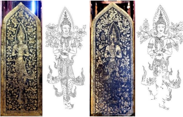
ภาพที่ 11 จิตรกรรมลายทองรูปเทวดา ราวพุทธศตวรรษที่ 25 ระดับธรรมมาสน์ วัดพันเตา จังหวัดเชียงใหม่

ศิลปกรรมรูปเทวดาแบบอย่างศิลปะรัตนโกสินทร์ พบบริเวณผนังของธรรมมาสน์ วัดพันเตา จังหวัดเชียงใหม่ เป็นลักษณะภาพบุคคล ยืนประนมมือระดับลวดลายพรรณพฤกษาดอกพุดตาน และลายมุกไฟในศิลปะจีน ศิราภรณ์ทรงมงกุฎ มีดอกไม้ไหวล้อมด้วยประภามณฑลคล้ายรูปเทวดายุคต้น มีเกี้ยวซ้อนหลายชั้น ต่างกันที่ประภามณฑลล้อมเป็นทรงยอดแหลมคล้ายศิลปะรัตนโกสินทร์ สร้างด้วยเทคนิคลายรดน้ำบนพื้นรักสีดำ ซึ่งดั้งเดิมศิลปะล้านนาใช้เทคนิคลายคำบนพื้นรักผสมวัตถุดิบทำให้เกิดสี เรียกว่า “หาง” (ขาด) หรือพื้นสีแดง เทคนิคลายรดน้ำหรือลายคำน้ำรด เทคนิควิธีการนี้ได้รับอิทธิพลจากงานประดับตกแต่งลายทองทางภาคกลาง ลายรดน้ำเข้ามาสู่ในศิลปะล้านนาในระยะหลังประมาณต้นรัตนโกสินทร์ โดยใช้วิธีการเขียนด้วย “หรดาล” บนพื้นรักจากนั้นจึงขีดรักบาง ๆ ปิดด้วยแผ่นทองคำเปลว หลังจากนั้นใช้น้ำรดบนพื้นที่เขียนหรดาล (ลิปิกร มาแก้ว, 2558, น.14)