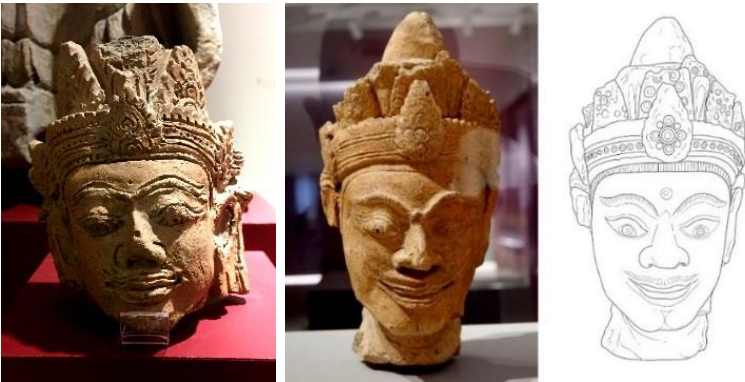
ภาพที่ 2 ประติมากรรมดินเผาเศียรเทวดา พิพิธภัณฑ์สถานแห่งชาติหริภุญไชย ลำพูน

ศิลปกรรมรูปเทวดากลุ่มนี้พบในกลุ่มจังหวัดลำพูน เป็นงานประติมากรรมรูปเศียรเทวดาหรือเศียรฤาษี สร้างขึ้นด้วยเทคนิคปูนปั้นและดินเผา พบหลักฐานเพียงเศียรและวรกายส่วนบน ศิราภรณ์จะมีอุณห์ทิศหรือกระบังหน้า มีตาบรูปรทงสามเหลี่ยมประดับอยู่ตรงกลาง ถัดขึ้นไปเป็นตาบรูปรทงสามเหลี่ยม คล้ายใบไม้ปลายแหลม บ้างเรียก “เทริดขนนก” หรือ มงกุฎสามตาบ” บากลายซ้อนชั้นไล่เรียงกันโดยรอบ ส่วนยอดเป็นปลายแหลม ลักษณะคล้ายศิราภรณ์ในศิลปะอินเดียนาผ่านมาทางศิลปะพุกาม (ภาพที่ 1) ลวดลายที่อยู่ในส่วนต่าง ๆ มีลักษณะคล้ายการขูดหรือเขียนเส้น รวมถึงการปั๊มประทับในจังหวะซ้ำโดยรอบศิราภรณ์เป็นลวดลายประดับ