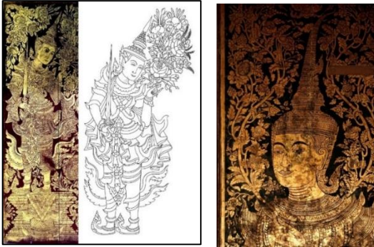
ภาพที่ 12 ทวารบาลตู้พระธรรม พิพิธภัณฑสถานแห่งชาติ เชียงใหม่ (ซ้าย) ทวารบาลประตู วิหารลายคำ วัดพระสิงห์วรมหาวิหาร จังหวัดเชียงใหม่ (ขวา)

นอกจากนี้ยังพบจิตรกรรมลายทองทวารบาลประตู วิหารลายคำ วัดพระสิงห์วรมหาวิหาร จังหวัดเชียงใหม่ และตู้พระธรรม พิพิธภัณฑสถานแห่งชาติ เชียงใหม่ เป็นรูปเทวดาในลักษณะยืนพระขรรค์ และช่อเกลาายดอก พุดตานพรรณพุกษา ที่เด่นชัดที่สุดคือศิราภรณ์อย่างศิลปะภาคกลาง มีเกี่ยวรัดเกล้า ชั้นกระบัง และเกี่ยวตามลำดับ ปลายยอดขึ้นเป็นยอดแหลมบัดไปด้านหลังประดับปีกา (ขนนก) ทัดหูด้วยกรรเจียกจอน ประดับพระกรรณด้วย กุณฑล คล้ายชฎายอดเดินหนในงานจิตรกรรมศิลปะรัตนโกสินทร์ การนุ่ง พัสตราภรณ์จะเป็นแบบศิลปะพม่า มีลักษณะชายผ้าบริเวณด้านข้างท่อนขาที่ ม้วนพับสลับกัน รวมถึงการใช้ผ้าผืนยาวพาดผ่านลำตัว และต้นแขนเป็นลักษณะ ที่พบในศิลปะพม่า ลวดลายผ้ามีลายดอกสี่กลีบเป็นแบบแผนมากขึ้นแต่ไม่ ละเอียดย่างช่างหลวงในกรุงเทพฯ เนื่องจากคุ้นเคยกับแบบอย่างศิลปะพม่า มานานฝีมือช่างรุ่นหลังนี้จึงเป็นแบบผสม ซึ่งสังเกตได้จากรูปเทวดาตู้พระธรรม ซึ่งเป็นลายรดน้ำเห็นได้ชัดว่า รูปเทวดามีเครื่องอาภรณ์ประดับ และลวดลาย แบบอย่างศิลปะพม่าในองค์ประกอบต่าง ๆ