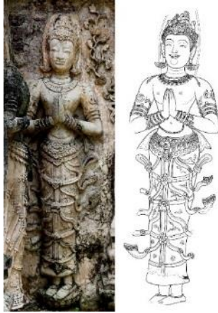
ภาพที่ 7 ประติมากรรมปูนปั้น และภาพลายเส้นสันนิษฐานรูปเทวดา พุทธศตวรรษที่ 20 วิหารมหาโพธาราม วัดเจ็ดยอด