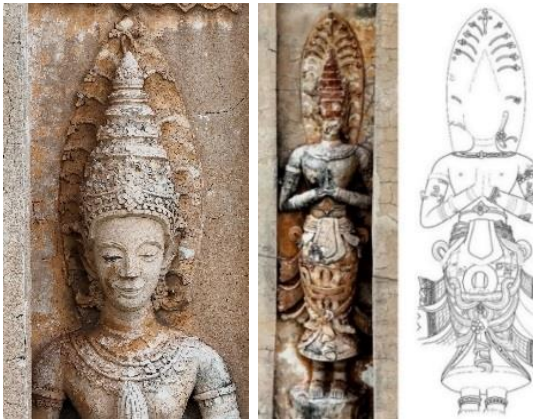
ภาพที่ 8 ประติมากรรมปูนปั้น และภาพลายเส้นสันนิษฐานรูปเทวดา ปลายพุทธศตวรรษที่ 21 เจดีย์วัดโลกโมฬีอาราม จังหวัดเชียงใหม่

ดังนั้นศิลปกรรมรูปเทวดาแบบลังกา ในพุทธศตวรรษที่ 20-21 เป็นรูปแบบที่ได้รับแบบอย่างจากศิลปะลังกาโดยผ่านทางสุโขทัย อีกทั้งยังส่งอิทธิพลทางด้านรูปแบบศิลปกรรมในเมืองเชียงใหม่ยุคต่อมา ดังปรากฏในงานประติมากรรมรูปเทวดาประจำทิศเจดีย์ วัดโลกโมฬีอาราม จังหวัดเชียงใหม่ ประติมากรรมดังกล่าวเป็นรูปเทวดายืนประนมหัตถ์อยู่เหนือดอกบัว ภายในประภามณฑลล้อมรอบศิราภรณ์ด้วยดอกไม้ไหว เหนือขึ้นไปนั้นกางกั้นด้วยฉัตรร่ม รวมถึงรูปเทวดาประจำทิศซุ้มโขง อุโบสถ และผนังห่อไตร วัดพระสิงห์วรมหาวิหาร จังหวัดเชียงใหม่ ที่ได้แบบอย่างแรงบันดาลใจทั้งรูปแบบ และคติการสร้างจากรูปเทวดาที่วิหารวัดเจ็ดยอด (ศักดิ์ชัย สายสิงห์, 2563, น.82) พัฒนาผสมผสานรูปแบบศิลปะรัตนโกสินทร์ และศิลปะพม่า จากลวดลายประกอบอาคารณัฏฐกรรเจ็ดยอดจวบจนเป็นต้น ซึ่งอาจปรากฏในช่วงการบูรณะในล้านนายุคหลัง