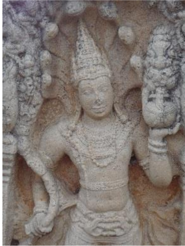
ภาพที่ 3 ประติมากรรมรูปมนุษย์ขนาด ศิลปะลังกา วัดอภัยคีรีมหาวิหาร ประเทศศรีลังกา (ที่มา : เฉลิมพล โตสารเดช, 2551)