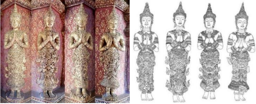
ภาพที่ 9 ประติมากรรมปูนปั้น และภาพลายเส้นสันนิษฐานรูปเทวดา จากประติมากรรมรูปเทวดาประจำทิศ ราวกลางพุทธศตวรรษที่ 24 โขงพระเจ้าภายในพระอุโบสถ วัดพระสิงห์วรมหาวิหาร จังหวัดเชียงใหม่