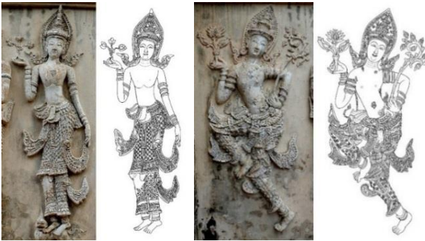
ภาพที่ 10 ประติมากรรมปูนปั้น และลายเส้นสันนิษฐานรูปเทวดา ปลายพุทธศตวรรษที่ 25 หอไตร วัดพระสิงห์วรมหาวิหาร จังหวัดเชียงใหม่

ศิลปกรรมรูปเทวดาในกลุ่มนี้มีความแตกต่างจากศิลปกรรมรูปเทวดาในกลุ่มศิลปะทวารวดีอย่างสิ้นเชิง กล่าวได้ว่าเป็นแบบอย่างที่ได้รับแรงบันดาลใจจากศิลปะลังกา สุโขทัย อโยธยา และจีน ซึ่งผสมผสานอยู่ร่วมกัน จากปัจจัยของการเผยแผ่พุทธศาสนา ลัทธิลังกาวงศ์ การเมืองการปกครอง ศิลปกรรมในกลุ่มนี้