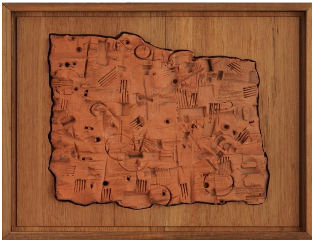
ภาพที่ 6 ผลงาน Trace 4

ประติมากรรมนูนต่ำ เทคนิค ศิลปะดินเผาร่วมสมัย โลหะเหลือใช้ (ที่มา : พศุตม์ กรรณรัตน์สูตร, 2567)