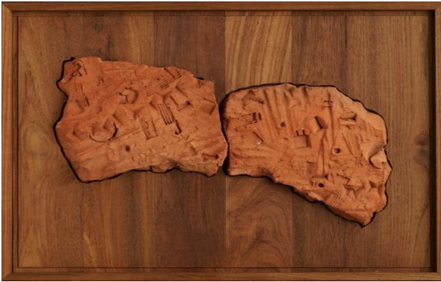
ภาพที่ 7 ผลงาน Trace 5

ประติมากรรมนูนต่ำ เทคนิค ศิลปะดินเผาร่วมสมัยบนไม้สัก