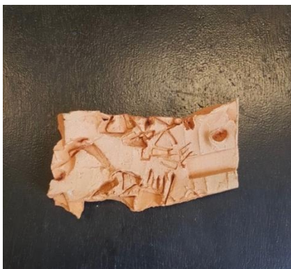
ภาพที่ 3 ผลงาน Trace 1

เหลือใช้ ไม่ว่าจะเป็นจากอุตสาหกรรม และอื่น ๆ เพื่อวิเคราะห์บทบาทของการใช้วัสดุเหลือใช้ในแง่ของความงาม และแนวคิดทางศิลปะ การทดลองและข้อค้นพบเกี่ยวกับการใช้ขยะวัสดุเหลือใช้ในศิลปะดินเผาร่วมสมัยในฐานะการบันทึกความทรงจำและสะท้อนอารยธรรม