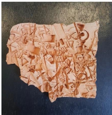
ภาพที่ 4 ผลงาน Trace 2

ประติมากรรมนูนต่ำ เทคนิค ศิลปะดินเผาร่วมสมัยบนไม้อัด