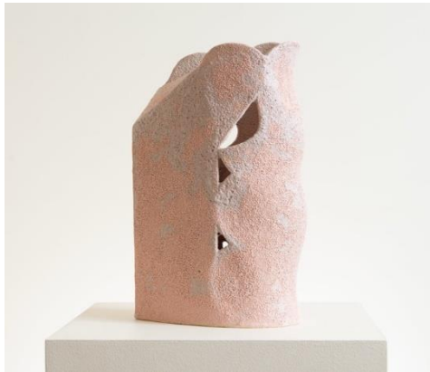
ภาพที่ 2 ผลงาน Magmatic โดย Bettina Willner-Browne ภาพถ่ายโดย Cairo Willner- Browne (ที่มา : Wilson, 2020)

ผลงานของ Bettina แสดงถึงความสัมพันธ์ระหว่างมนุษย์กับดินเผาในบริบทของวัฒนธรรมร่วมสมัย Bettina มีส่วนร่วมในนิทรรศการที่เกี่ยวข้องกับศิลปะและสิ่งแวดล้อม โดยใช้เทคนิคเฉพาะในการผสมเศษเซรามิก และวัสดุเหลือใช้ลงในเนื้อดินเพื่อลดการใช้ทรัพยากรใหม่ ผลงานของ Bettina ได้รับการยอมรับว่าเป็นตัวอย่างที่ดีของการบูรณาการศิลปะเข้ากับแนวคิดด้านการอนุรักษ์ธรรมชาติ และเศรษฐกิจหมุนเวียน ซึ่งเป็นแนวคิดหลักในการศึกษานี้ (Xu, Tan and Lin, 2024, p.22)