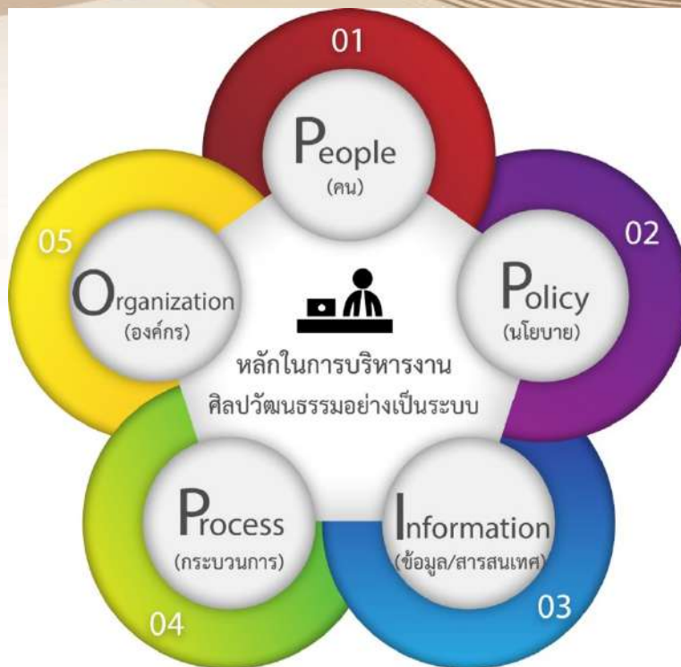
ภาพที่ ๒ หลักในการบริหารงานศิลปวัฒนธรรมอย่างเป็นระบบ

หลักในการบริหารงานของสำนักศิลปะและวัฒนธรรม มหาวิทยาลัยราชภัฏบ้านสมเด็จเจ้าพระยา จะมีแนวทางการดำเนินงานโดยสานต่องานเดิม ริเริ่มงานใหม่โดยใช้หลักธรรมาภิบาลในการบริหารงาน นอกจากนี้ยังได้เสนอหลักการในการบริหารงานด้านศิลปวัฒนธรรมอย่างเป็นระบบ (PPIPO) เพื่อเป็นกลไก ในการขับเคลื่อนองค์กร ให้มีประสิทธิภาพมากยิ่งขึ้นโดยมีรายละเอียดดังต่อไปนี้