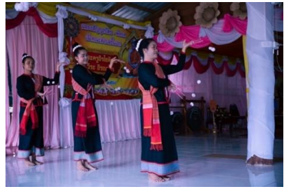
ภาพที่ 3 การแต่งกายของการฟ้อนกูไทกะตาก บ้านโนนหอม

ผ้าเปียงนิยมนำผ้าแพรขิดสีแดง พาดไหล่ซ้ายแล้วไปมัดที่เอวด้านขวา สวมส่วยมือยาว(เล็บ) ทำมาจากกระดาษหรือโลหะพันด้วยด้ายและมีพู่ที่ ปลายเล็บสีขาวหรือแดง ผมหัก้ามวยมัดมวยผมด้วยผ้าแดงบางครั้งก็ทัดผม ด้วยดอกไม้สีขาวหรือไม้ก้านฝ้ายกูไท และสวมเครื่องประดับเงิน เช่น สร้อยคอ ต่างหู และกำไล