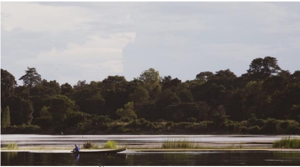
ภาพที่ 1 หนองฮากสายน้ำแห่งวิถีชีวิตชาวภูไทเขตตาก บ้านโนนหอม

จากชุดท่วงท่าดังกล่าว จะเห็นได้ว่าการสร้างสรรค์ศิลปะการแสดง ฟ้อนภูไทเกี่ยวข้องกับกับนิเวศวัฒนธรรมหรือสภาพแวดล้อมในเชิงของพื้นที่ โดยเฉพาะแหล่งน้ำหนองหารและหนองฮาก ดังนั้นวิถีชีวิตของผู้คนจึงผูกพันไปกับสายน้ำสะท้อนผ่านชื่อท่าบัวตูม บัวบาน รวมถึงสะท้อนผ่านอาชีพจากท่าบั้งแสงสุริยาเนื่องจากชาวภูไทมีอาชีพทำนาเป็นอาชีพหลัก และท่าที่เกี่ยวข้องกับตำนานความเชื่อเรื่องของพญานาค สะท้อนจากตำนานคิม้วนหาง และนางไอลีโยบาท (ดอน) รวมถึงการเอาชื่อนกในท้องถิ่นมาตั้งเป็นชื่อท่าอย่างท่าแสวงแสหวาดหรือท่ามยุเรศรำแพน ดังนั้นจะเห็นได้ว่าท่าฟ้อนภูไท ทั้ง 6 ท่า เกี่ยวข้องกับสภาพแวดล้อมและวิถีชีวิตของชาวภูไท แสดงให้เห็นถึงต้นทุนทางวัฒนธรรมและต้นทุนทางธรรมชาติ โดยเฉพาะสายน้ำผ่านเรื่องเล่าหรือตำนานของจังหวัดสกลนคร ซึ่งบ้านโนนหอมก็เป็นพื้นที่ส่วนหนึ่งของตำนานเรื่องราวเล่าขานด้วยเช่นกัน โดยมีชื่อเรียกสถานที่แห่งนี้ว่า หนองฮาก