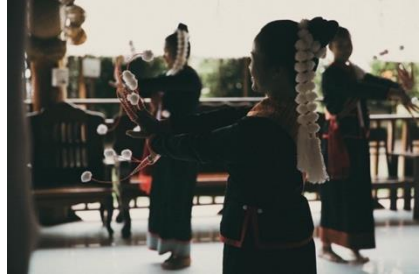
ภาพที่ 4 การฟ้อนภูไทกะตาก บ้านโนนหอม