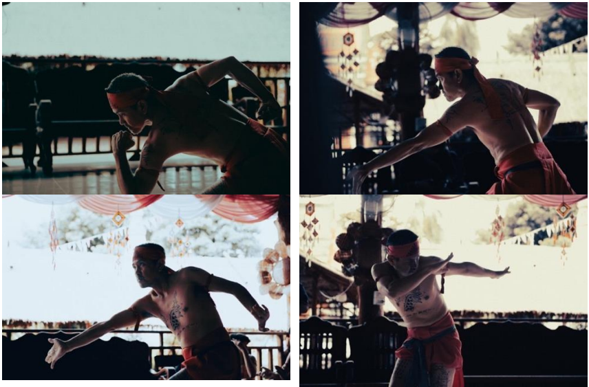
ภาพที่ 7 มวยโบราณชาติพันธุ์ภูไทกะตาก บ้านโนนหอม

หรือสร้างความรำคาญขณะที่นักมวยกำลังแสดง โดยในหัวข้อนี้ ผู้เขียน สร้างสรรค์และถ่ายภาพผ่านผลงานภาพถ่ายย้อนแสงออกมาด้วยการเข้าไป ทำความเข้าใจพื้นที่ทางจิตวิญญาณของนักมวยระหว่างทำการแสดง จึงใช้ การออกแบบด้วยมุมมองแบบผู้เฝ้ามองแบบเดียว โดยภาพทั้งหมดมีด้วยกัน 4 ภาพ เป็นชุดทำให้วัครูหรือรำเดี่ยวที่เต็มไปด้วยมนต์ขลังผ่านการสื่อสาร จากมุมมองของผู้เขียนที่สะท้อนอัตลักษณ์นาฏกรรมในนิเวศวัฒนธรรมชาติพันธุ์ ภูไทกะตาก บ้านโนนหอม มากที่สุด ทั้งท่วงท่าการแสดง การแต่งกาย รอยสัก และบรรยากาศของภาพ