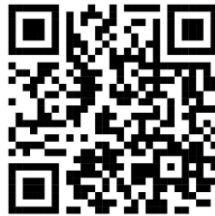
ภาพที่ 2 แบบฝึกหัดคั่นซักซอู้ (ที่มา : นภสินธุ์ อีร์พันธ์วรารพร, 2567)

ตอนที่ 4 แบบฝึกหัดคั่นซักซอู้ในบทนี้จะประกอบไปด้วย วิธีการจับคั่นซักซอู้ การจับคั่นทวนซอู้แบบเปิดฝ่ามือ การจับคั่นทวนซอู้แบบปิดฝ่ามือ วิธีจับคั่นซักซอู้ การสีซอู้สายเอกและสายทุ้ม เป็นแบบฝึกเริ่มต้นของซอู้