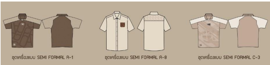
ภาพที่ 5 ภาพชุดเครื่องแบบกึ่งทางการ (Semi Formal) ที่มีความชื่นชอบมากที่สุด อันดับที่ 1 (ที่มา : ภัคพล เมฆสุวรรณ, 2567)

สำหรับการวิเคราะห์ความชื่นชอบแบบร่างชุดเครื่องแบบกึ่งทางการ Semi Formal ใน Concept A , Concept B และ Concept C ซึ่งมีแบบร่างจำนวน 18 ชุดต่อ Concept โดยสำรวจจากกลุ่มตัวอย่าง จำนวน 21 คน ประกอบไปด้วย นิสิตชั้นปีที่ 3 นิสิตชั้นปีที่ 4 อาจารย์ เจ้าหน้าที่ประจำหลักสูตรฯ และเจ้าหน้าที่สำนักงานคณบดี จากการวิเคราะห์ความชื่นชอบแบบร่างชุดเครื่องแบบกึ่งทางการ (Semi Formal) พบว่าแบบร่างที่มีผู้ชื่นชอบมากที่สุดเป็นอันดับ 1 คือ ชุดเครื่องแบบ Semi Formal A-1 คิดเป็นร้อยละ 21.74 ชุดเครื่องแบบ Semi Formal A-8 ร้อยละ 21.74 และชุดเครื่องแบบ Semi Formal C-3 ร้อยละ 21.74 (ดังภาพที่ 5) แบบร่างที่มีผู้ชื่นชอบเป็นอันดับที่ 2 คือ ชุดเครื่องแบบ Semi Formal A-2 ร้อยละ 17.39 และชุดเครื่องแบบ Semi Formal A-16 ร้อยละ 17.39 และแบบร่างที่มีผู้ชื่นชอบเป็นอันดับ 3 คือ ชุดเครื่องแบบ Semi Formal C-10 ร้อยละ 13.04 ตามลำดับ