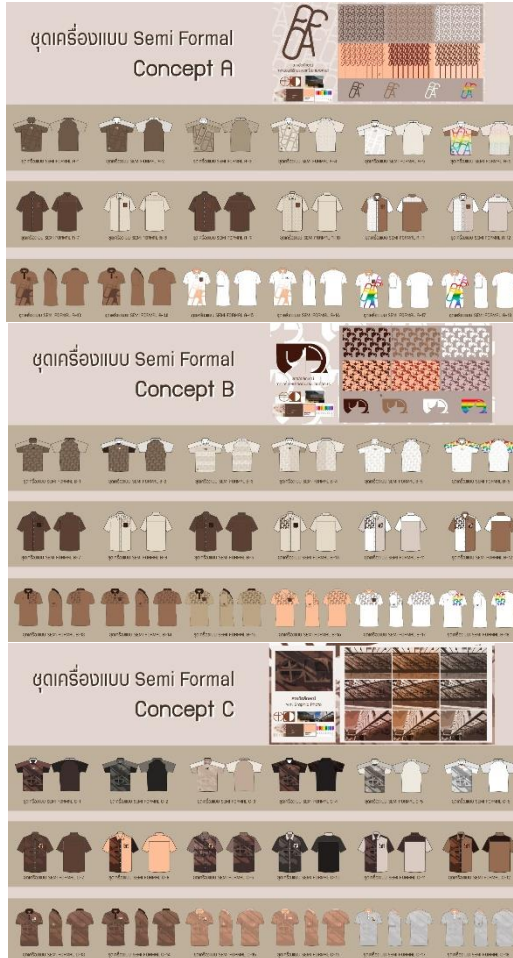
ภาพที่ 4 การวางลวดลายอัตลักษณ์บนโครงร่างเงาของเสื้อ (Silhouette) ชุดเครื่องแบบ Semi Formal Concept A, ชุดเครื่องแบบ Semi Formal Concept B และ ชุดเครื่องแบบ Semi Formal Concept C

รูปแบบแขนเสื้อและกระเป๋าสี้อยู่ให้มีความเหมาะสม อีกทั้งเพื่อให้สอดคล้องกับการใช้งานจริง รวมถึงการสื่อถึงภาพลักษณ์ของคณะศิลปกรรมศาสตร์ มหาวิทยาลัยศรีนครินทรวิโรฒ ได้อย่างมีประสิทธิภาพมากยิ่งขึ้น