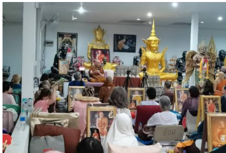
ภาพที่ 2 อุบาสก และอุบาสิกา ผู้เข้าร่วมพิธีกรรม การสวดมนต์เจริญภาวนาบทพระคาถามหาจักรพรรดิ