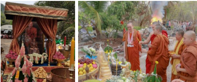
ภาพที่ 3 ประรำพิธีการบวงสรวง การหล่อพระสมเด็จพระสังฆราชเจ้ากรมการปกครอง

ปะรำพิธี จากนั้นประกอบพิธีบวงสรวงเทพยดา 16 ชั้นฟ้า 15 ชั้นดิน 14 ชั้นบาดาล 12 ท้องพระโรง เบื้องหน้าปะรำพิธี โดยผู้ที่ทำพิธีบวงสรวง คือ พระภิกษุสงฆ์ ผู้ที่มีความใกล้ชิดกับพระวรวงศ์ วิริยโร หรือหลวงตาม้า ในระหว่างนั้นนายช่างนำแผ่นทองเหลืองที่ผู้เข้าร่วมพิธีร่วมกันเขียนชื่อ นามสกุล และวันเดือนปีเกิด ลงในเบ้าหลอม จากนั้นนายช่างเทน้ำทองเหลืองลงเบ้าหลอม สมเด็จพระสังฆราชเจ้ากรมการปกครอง และในระหว่างที่นายช่างกำลังเทน้ำทองเหลืองลงในเบ้าหล่อพระนั้น พระวรวงศ์ วิริยโร หรือหลวงตาม้า นำอุบาสก อุบาสิกา และบุคคลผู้เข้าร่วมประกอบพิธีเททองหล่อสมเด็จพระสังฆราชเจ้ากรมการปกครอง สวดบทพระคาถามหาจักรพรรดิ และบทอื่น ๆ เมื่อนายช่างเทน้ำทองเหลืองลงในเบ้าหล่อพระเสร็จสิ้น พระวรวงศ์ วิริยโร หลวงตาม้า สวดบท “ชยันโต” จำนวน 3 จบ เป็นอันเสร็จพิธีกรรม