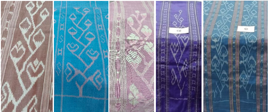
ภาพที่ 5 แสดงการออกแบบลายจากการรับรู้ความหมาย และรูปแบบใหม่ลายดอกฝ้ายเมืองเลย (ที่มา : ไทยโรจน์ พวงมณี, 2566)

ดังนั้นผ้าทอลายดอกฝ้ายเมืองเลยจึงเป็นผ้าทอที่ถูกสร้างขึ้นให้มี อัตลักษณ์ประจำจังหวัดเลยที่ผ่านการขับเคลื่อนและผลักดันอย่างต่อเนื่อง โดยมีการติดตามและประเมินผลการดำเนินการพัฒนาอย่างใกล้ชิดจากภาครัฐ จึงสร้างผลกระทบทางสังคมและทางเศรษฐกิจให้กับชุมชนและจังหวัดเลย ได้เป็นอย่างมาก ดังเช่นการทำให้กลุ่มวิสาหกิจชุมชนเกิดการตื่นตัวและ ตระหนักรู้ต่อคุณภาพของผ้าทอ โดยมีการปรับปรุงกระบวนการทอผ้าอย่างเป็น