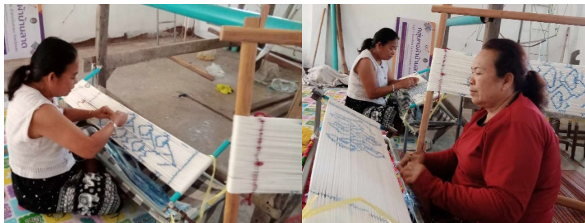
ภาพที่ 3 แสดงการมัดหมี่และการทอผ้าลายดอกฝ้ายเมืองเลย ของกลุ่มวิสาหกิจชุมชนทอผ้าบ้านลาด

อย่างไรก็ดีการยกระดับคุณค่าภูมิปัญญาผ้าทอพื้นบ้านลายดอกฝ้ายเมืองเลยได้ถูกเชื่อมโยงให้อยู่ภายใต้อุดมการณ์ของจังหวัดเลยและประโยชน์ด้านเศรษฐกิจผ่านกระบวนการผลิตซ้ำ เพื่อช่วยให้กลุ่มวิสาหกิจชุมชนทอผ้าได้มีคุณภาพ มีความละเอียดและประณีตมากขึ้น และการผลิตซ้ำยังพัฒนาทักษะการทอของช่างทอให้มีมาตรฐานสูงขึ้น มีทักษะการคิดเชิงสร้างสรรค์จนสามารถดัดแปลงและปรับปรุงลายดอกฝ้ายเมืองเลยไปสู่ความเป็นรูปแบบอื่น ๆ ที่แปลกใหม่ โดดเด่น และแตกต่างไปจากเดิมได้ อย่างไรก็ตามการผลิตซ้ำอย่างต่อเนื่องจะทำให้ช่างทอชำนาญการทอผ้า ย่อมเป็นตัวชี้วัดถึงศักยภาพและมาตรฐานของผ้าทอพื้นบ้านด้วย (กิตติกรณ์ บำรุงบุญ และปิยลักษณ์ โพธิวรรณ, 2563, น.117-126) สำหรับการผลิตซ้ำผ้าทอลายดอกฝ้ายเมืองเลยที่ยังคงมีการผลิตอย่างต่อเนื่องตามความต้องการใช้งานของผู้บริโภคในหน่วยงานภาครัฐและประชาชนทั่วไปที่สนใจ สามารถสร้างรายได้ให้กับกลุ่มวิสาหกิจชุมชนเป็นอย่างดี