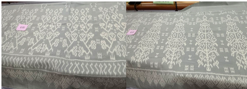
ภาพที่ 7 แสดงผ้าทอลวดลายดอกฝ้ายเมืองเลย (ขวา) ลวดลายเครือเถา (ซ้าย) ลวดลายต้นดอกฝ้าย