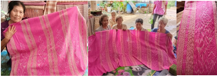
ภาพที่ 6 แสดงการผลิตซ้ำผ้าทอลายดอกฝ้ายเมืองเลย กลุ่มวิสาหกิจชุมชนบ้านโนนกกข่า

ดังนั้นการผลิตซ้ำผ้าทอลายดอกฝ้ายเมืองเลยเกิดผลดีต่อกลุ่มวิสาหกิจชุมชนทอผ้าทั้งด้านการเพิ่มทักษะและความชำนาญ จนนำไปสู่การพัฒนาสีและรูปแบบของลวดลายใหม่ ทำให้ผ้าทอมีคุณภาพและน่าสนใจมากขึ้น ดังเช่นการทอผ้าของกลุ่มวิสาหกิจชุมชนบ้านโนนกกข่าที่ใช้สีชมพูและตัดลายขีดขาเป็ยออกไปด้วยการเพิ่มลายขีดปกติที่ไม่แสดงลายชัดเจน ส่วนกลุ่มทอผ้าพื้นเมืองบ้านนาป่าหนาดได้มีการผลิตซ้ำอย่างต่อเนื่องจนผ้าทอมีคุณภาพมากเช่นเดียวกับการพัฒนาลายดอกฝ้ายเมืองเลย จึงเป็นไปตามแนวคิดและแนวทางอัตลักษณ์วิถีชีวิตไทดำได้ เช่น การนำแนวคิดต้นดอกไม้มาออกแบบ จึงทำให้มีรูปแบบลายผ้าใหม่เกิดขึ้นอย่างหลากหลาย จึงช่วยสร้างทางเลือกให้กับผู้บริโภคเป้าหมายที่ต้องการความโดดเด่นและแตกต่างด้วย อย่างไรก็ตามวิถีการทอผ้าด้วยแนวคิดการผลิตซ้ำของช่างทอแต่ละพื้นที่ได้แสดงให้เห็นว่าเป็นปัจจัยสำคัญที่ทำให้ช่างทอมีทักษะและความชำนาญในการใช้เครื่องมือและอุปกรณ์มากขึ้น โดยเฉพาะการส่งแรงกระทบจากมือสู่ฟืมที่เต็มเปี่ยมไปด้วยจิตวิญญาณของชุมชน เพื่อให้ผืนผ้าทอนั้นมีความแน่นและแข็งแรง นอกจากนี้ยังทำให้มีทักษะการคิดและการออกแบบลายหรือการทอแบบใหม่ ๆ ขึ้นมาระหว่างการทอผ้ามากยิ่งขึ้น