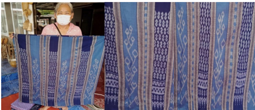
ภาพที่ 8 แสดงการออกแบบที่ผสมผสานลายดอกฝ้ายเมืองเลย กับลายขอและลายขีดให้แปลกใหม่