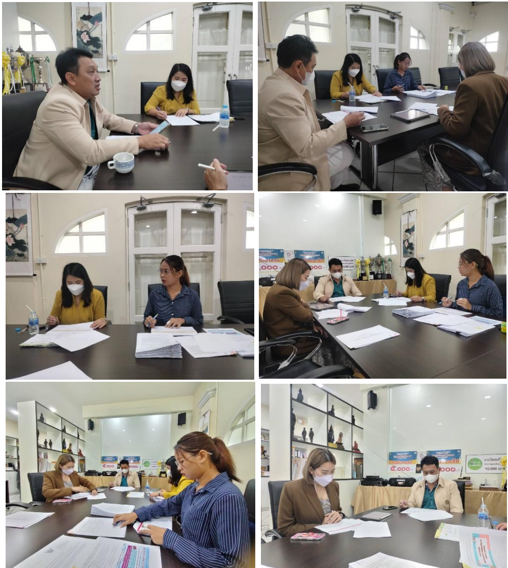
ภาพตัวอย่างการประชุมกองบรรณาธิการวารสารที่ทัศน์วัฒนธรรม