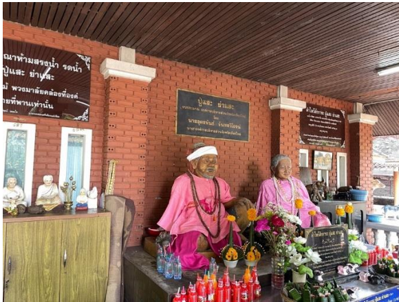
ภาพที่ 1 ศาลปู่และย่าแสะ

เลี้ยงผีตองปู่และย่าแสะ 2) ผู้ที่มีส่วนได้ส่วนเสียในการจัดการมรดกภูมิปัญญาทางวัฒนธรรม เพื่อการพัฒนาที่ยั่งยืนของประเพณีเลี้ยงผีตองปู่และย่าแสะ 3) ปัญหาและอุปสรรคในการจัดการมรดกภูมิปัญญาทางวัฒนธรรม เพื่อการพัฒนาที่ยั่งยืนของประเพณีเลี้ยงผีตองปู่และย่าแสะ และ 4) การจัดการมรดกภูมิปัญญาทางวัฒนธรรมประเพณีเลี้ยงผีตองปู่และย่าแสะ เพื่อการพัฒนาที่ยั่งยืน