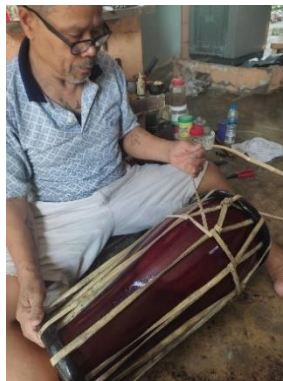
ภาพที่ 6 การใส่หนังเรียดและการรัดอก