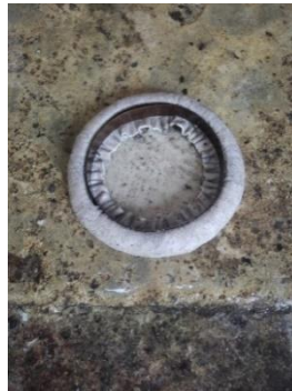
ภาพที่ 5 การม้วนขอบหนังหน้ากลองแขก