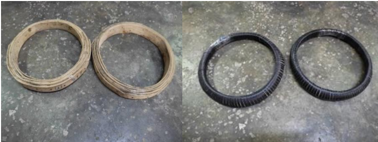
ภาพที่ 4 ขอบกลองแขก

สำหรับขั้นตอนการขึ้นหนังหน้ากลองแขกของครูสมพงศ์ ยอดพรหม นั้นเริ่มต้นจากลูกค่านำหุ่นของกลองแขกมาให้แล้วจะต้องทำการวัดขนาด ความกว้างของหน้าหุ่นกลอง เพื่อจะต้องทำขอบกลองที่สวมได้พอดีกับหุ่นกลอง ขอบกลองนั้นจะทำมาจากไม้ไผ่นำมาเหลาให้มีความกว้างประมาณ 3 เซนติเมตร แล้วม้วนให้เป็นวงกลมหนาประมาณ 2 เซนติเมตร หากเป็นหน้าต๋าน (หน้าเล็ก) จะมีขนาดเล็กลงอีกนิดหน่อย จากนั้นใช้สายพลาสติกที่ใช้รัดถังใส่ของมาพันให้รอบแล้วยึดด้วยตะปูขนาดเล็ก