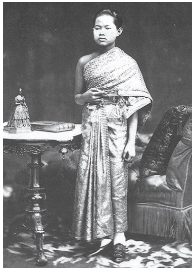
ภาพที่ 4 พระฉายาลักษณ์สมเด็จพระนางเจ้าสุนันทากุมารีรัตน์ พระบรมราชเทวี

ผู้สร้างสรรค์ผลงานจึงกำหนดให้รูปแบบการแต่งกายของพระนางแก้วเจ้าจอมเป็นรูปแบบการแต่งกายในสมัยต้นรัชกาลที่ 5 โดยมีแรงบันดาลใจมาจากพระฉายาลักษณ์ของสมเด็จพระนางเจ้าสุนันทากุมารีรัตน์ พระบรมราชเทวี โดยใช้วิธีการนุ่งห่มแบบโบราณด้วยการนุ่งสอด และวิธีการเย็บกลึงในรูปแบบของชุดไทยสไบเฉียง ห่มผ้าสะพัก มีสไบกรอง และนุ่งผ้าถุงด้วยวิธีจับหน้านางซึกชายพก