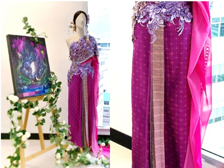
ภาพที่ 8 ผ้านุ่งยกไหมเทียมลายราชวัตรก้านแย่ง ในหุ่นแสดงแบบเครื่องแต่งกายพระนางแก้วเจ้าจอม