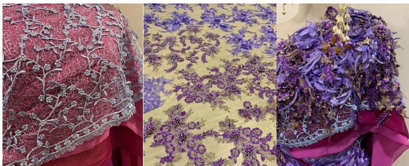
ภาพที่ 6 ผ้าซีฟองสีชมพูและผ้าลูกไม้ 3 รูปแบบที่ผู้สร้างสรรค์ ผลงานนำมาใช้ในการตัดเย็บผ้าสะพักและผ้าสไบ