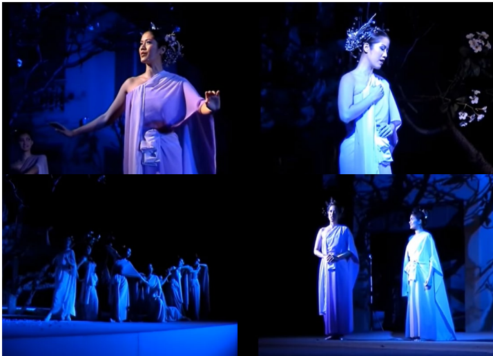
ภาพที่ 1 การแสดงประกอบเพลงกลิ่นแก้วเจ้าจอมในการแสดงละครเวที

ผู้สร้างสรรค์ผลงานใช้วิธีเก็บข้อมูลรายละเอียดเกี่ยวกับตัวละครพระนางแก้วเจ้าจอมและรูปแบบการแต่งกาย โดยการชมวีดิทัศน์การแสดงประกอบเพลงกลิ่นแก้วเจ้าจอม จากการแสดงละครเวทีเรื่องกลิ่นแก้วเจ้าจอมทั้งสองครั้งที่มหาวิทยาลัยราชภัฏสวนสุนันทาได้ทำการจัดแสดง จากนั้นจึงทำการศึกษาเนื้อเพลงกลิ่นแก้วเจ้าจอม ถอดความ และตีความหมายของเนื้อเพลง