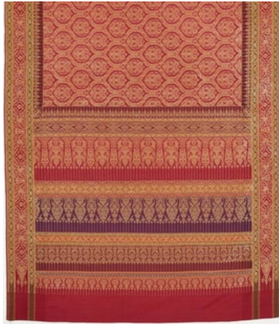
ภาพที่ 7 รูปแบบผ้ายกสังเวียนแบบกรวยเชิงซ้อนหลายชั้น