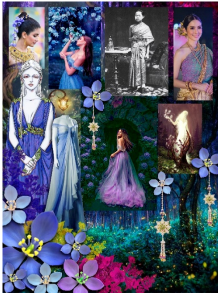
ภาพที่ 3 ภาพอ้างอิง (Reference board) สำหรับการออกแบบเครื่องแต่งกายพระนางแก้วเจ้าจอม

จากนั้นผู้สร้างสรรค์ใช้คำสำคัญ (Keyword) ที่ได้จากการค้นคว้าและรวบรวมข้อมูลเกี่ยวกับประวัติความเป็นมาของวังสวนสุนันทาและอัตลักษณ์ของมหาวิทยาลัยราชภัฏสวนสุนันทาที่สอดคล้องกับบทเพลงกลืนแก้วเจ้าจอมจำนวน 5 คำ ได้แก่ 1) ดอกแก้วเจ้าจอม 2) นางฟ้า 3) สวนสวรรค์ 4) ราชินางไม้ และ 5) วังสวนสุนันทา และนำมาใช้เป็นแนวคิดหลักสำหรับการสร้างภาพอ้างอิง (Reference board) โดยคัดเลือกรูปภาพที่สอดคล้องกับคำสำคัญทั้ง 5 คำ แล้วนำมาจัดเรียงเข้าด้วยกัน และใช้วิธีการตัดต่อหรือตัดปะภาพขึ้นมาใหม่ เพื่อให้ได้ภาพอ้างอิงที่สื่อถึงภาพรวมของตัวละครพระนางแก้วเจ้าจอม