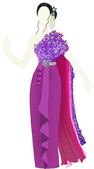
ภาพที่ 5 ภาพร่าง (Sketch) การออกแบบเครื่องแต่งกาย พระนางแก้วเจ้าจอม

จากนั้นจึงทำการร่างแบบและใส่รายละเอียดของชุด โดยอ้างอิงจากภาพอ้างอิง (Reference board) โดยเลือกใช้โทนสีจากรูปภาพประกอบโทนสีและอารมณ์ (Mood and Tone) และแถบสี (Color Chart)