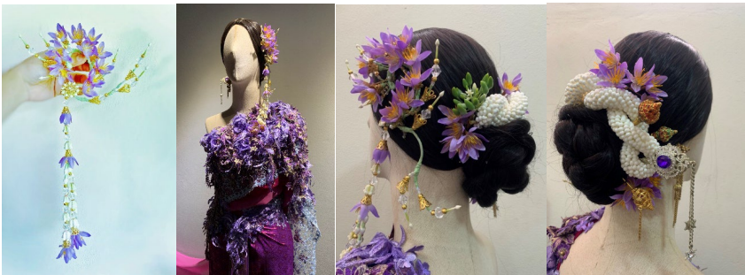
ภาพที่ 9 เครื่องประดับพระนางแก้วเจ้าจอม กรรเจียกจรแบบใหม่ (Ear Cuff) อุบะยาวติดกับกรรเจียกจร ช่อดอกแก้วเจ้าจอม มาลัยดอกพุดบิตเกลียวประดับผม และปิ่นปักผมทั้งแบบโลหะและงานดอกไม้ประดิษฐ์

เมื่อชุดเสร็จเรียบร้อยแล้ว ในครั้งแรกผู้สร้างสรรค์ผลงานเลือกใช้เครื่องประดับโลหะสีเงินที่ประดับด้วยเพชรสีขาว เพื่อให้ภาพรวมของชุดเกิดความระยิบระยับ แทนสภาวะความเป็นทิพย์ของพระนางแก้วเจ้าจอม แต่พบว่าเครื่องประดับโลหะบางชิ้นที่เป็นลักษณะรูปทรงเรขาคณิตที่ชัดเจน กลับสร้างอารมณ์ความรู้สึกแข็งทื่อ ขัดกับภาพลักษณ์และสภาวะความเป็นนางไม้ของพระนางแก้วเจ้าจอม ผู้สร้างสรรค์ผลงานจึงได้ทำการปรับเปลี่ยนรูปแบบเครื่องประดับเป็นลักษณะของงานดอกไม้แห่งประดิษฐ์ เช่น ดอกพุดดินปั้น ดอกกรักดินปั้น ดอกแก้วเจ้าจอมดอกปลอม ผสมผสานกับเครื่องตกแต่งชนิดอื่น ๆ ได้แก่ ลูกปัดทอง ลูกปัดคริสตัล กลีบขี้โลหะชุบทอง เป็นต้น มาเรียงร้อยและสร้างสรรค์ขึ้นมาเป็นเครื่องประดับที่ร่วมสมัยและสร้างความรู้สึกถึงความเป็นธรรมชาติและความเป็นนางไม้ของพระนางแก้วเจ้าจอมมากยิ่งขึ้น อาทิ กรรเจียกจรแบบใหม่ (Ear Cuff) อุบะยาวติดกับกรรเจียกจร ช่อดอกแก้วเจ้าจอม มาลัยดอกพุดบิตเกลียวประดับผม และปิ่นปักผมทั้งแบบโลหะและงานดอกไม้ประดิษฐ์ เป็นต้น