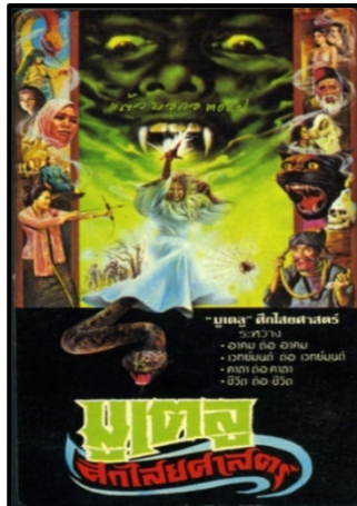
ภาพที่ ๑ ภาพยนตร์มูเตลู ศักดิ์ไสยศาสตร์

มูเตลู (Mutelu) เป็นชื่อมาจากชื่อของภาพยนตร์สยองขวัญของชาวอินโดนีเซียที่ออกฉายในประเทศไทยในช่วงทศวรรษที่ ๑๙๘๐ หรือ ๑๙๙๐ ซึ่งมีชื่อภาษาไทยว่า มูเตลู ศักดิ์ไสยศาสตร์ (Mutelu: Occult War) ดังแสดงในภาพที่ ๑