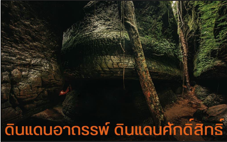
ภาพที่ ๒ ถ้ำนาคา อุทยานแห่งชาติภูถ้ำกา อำเภอบึงโขงหลง จังหวัดบึงกาฬ