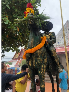
ภาพที่ ๔ พระบรมรูปพระเจ้าตากสินทรงม้า

๒. พระบรมรูปพระเจ้าตากสินมหาราช ประทับนั่งเหนือพระราชอาสน์ หันพระพักตร์ไปทางเบื้องขวาเล็กน้อย พระหัตถ์ทั้งสองข้างจับพระแสงดาบ พาดเหนือพระเพลา อยู่ใกล้บริเวณพระอุโบสถ (ใหม่) ซึ่งเคยเป็นที่ประดิษฐานฝังพระบรมศพของพระเจ้าตากสิน ดังภาพที่ ๕