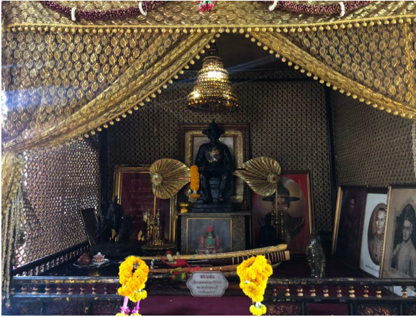
ภาพที่ ๓ พระแท่นพระเจ้าตากสิน

๓. พระแท่น เชื่อกันว่าเป็นพระราชาอาสน์ที่พระองค์ทรงประทับและสำหรับนั่งกรรมฐาน ปัจจุบันวัดได้นำรูปเคารพพระเจ้าตากสินจำลองมาวางไว้บนแท่น และยังมีการนำภาพวาดพระเจ้าตากสิน และอาวุธมาวางไว้ประกอบกันเป็นวัตถุสัญลักษณ์สื่อถึงพระเจ้าตากสินได้เป็นอย่างดี ดังภาพที่ ๓