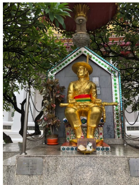
ภาพที่ ๕ พระบรมรูปพระเจ้าตากสินประทับนั่ง

๒. พระบรมรูปพระเจ้าตากสินมหาราช ประทับนั่งเหนือพระราชอาสน์ หันพระพักตร์ไปทางเบื้องขวาเล็กน้อย พระหัตถ์ทั้งสองข้างจับพระแสงดาบ พาดเหนือพระเพลา อยู่ใกล้บริเวณพระอุโบสถ (ใหม่) ซึ่งเคยเป็นที่ประดิษฐานฝังพระบรมศพของพระเจ้าตากสิน ดังภาพที่ ๕