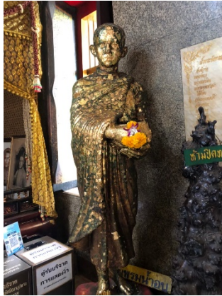
ภาพที่ ๗ พระบรมรูปสมเด็จพระเจ้าตากสินขณะทรงผนวช

๕. พระบรมรูปพระเจ้าตากสินนั่งวิปัสสนากรรมฐาน ซึ่งสอดคล้องกับเรื่องเล่าที่กล่าวว่าพระเจ้าตากสินเคยมานั่งวิปัสสนากรรมฐาน ที่วัดอินทารามวรวิหารแห่งนี้ ดังภาพที่ ๘