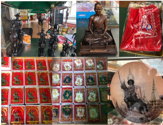
ภาพที่ ๙ วัดถุมงคลพระเจ้าตากสิน

๒.๓ วัดถุมงคล จากการศึกษาพบว่า วัดถุมงคลที่เกี่ยวกับพระเจ้าตากสิน ที่วัดอินทารามวรวิหารมีหลายลักษณะด้วยกัน ได้แก่ สถูปเกอรัตรีถยนต์ ฝ้ายยันต์ รูปเคารพจำลองในลักษณะทรงม้าออกรบ และเหรียญเคารพ จากการสังเกตพบว่า เหรียญเคารพจะมีจำนวนมากหลายรุ่น โดยส่วนใหญ่จะมีรูปพระเจ้าตากสินในพระอิริยาบถที่แตกต่างกันไป ส่วนใหญ่จะเน้นการออกรบ และการนั่งบัลลังก์ โดยมีดาบวางอยู่บนพระเพลาดังภาพที่ ๙