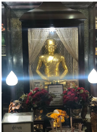
ภาพที่ ๘ พระบรมรูปพระเจ้าตากสินนั่งวิปัสสนากรรมฐาน

๕. พระบรมรูปพระเจ้าตากสินนั่งวิปัสสนากรรมฐาน ซึ่งสอดคล้องกับเรื่องเล่าที่กล่าวว่าพระเจ้าตากสินเคยมานั่งวิปัสสนากรรมฐาน ที่วัดอินทารามวรวิหารแห่งนี้ ดังภาพที่ ๘