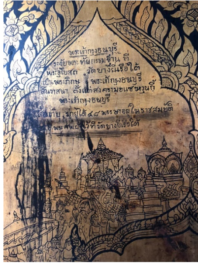
ภาพที่ ๑๑ ภาพจิตรกรรมจารบนแผ่นทอง

วัดอินทารามวรวิหาร นั้นคือภาพจิตรกรรมที่มีเนื้อหาระบุว่า วัดอินทาราม วรวิหารแห่งนี้เป็นที่วิปัสสนากรรมฐาน และเป็นที่บรรจุพระบรมอัฐิของ พระเจ้าตากสิน ดังภาพที่ ๑๑