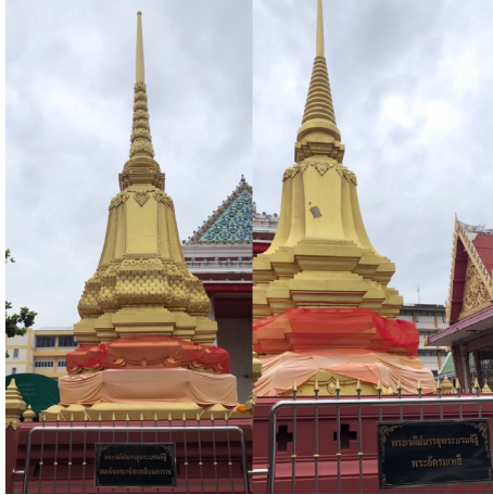
ภาพที่ ๑ พระเจดีย์คู่ ที่วัดอินทารามวรวิหาร

๒. พระพุทธรูปฉลองพระองค์ พระพุทธรูปฉลองพระองค์ของสมเด็จพระเจ้ากรุงธนบุรีเป็นพระประธานภายในพระอุโบสถหลังเดิมปางตรัสรู้ภายในองค์พระประดิษฐานพระบรมราชสรีรังคารของพระเจ้าตากสิน ดังภาพที่ ๒