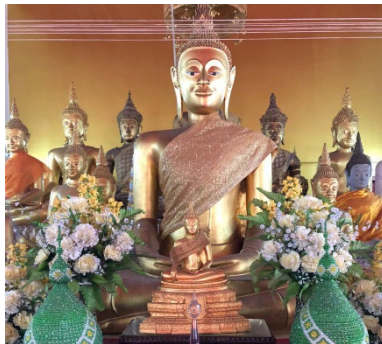
ภาพที่ ๒ พระพุทธรูปฉลองพระองค์

๒. พระพุทธรูปฉลองพระองค์ พระพุทธรูปฉลองพระองค์ของสมเด็จพระเจ้ากรุงธนบุรีเป็นพระประธานภายในพระอุโบสถหลังเดิมปางตรัสรู้ภายในองค์พระประดิษฐานพระบรมราชสรีรังคารของพระเจ้าตากสิน ดังภาพที่ ๒