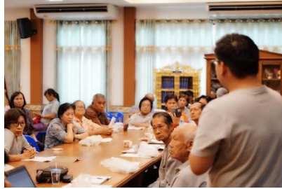
ภาพที่ ๓ การมีส่วนร่วมของผู้มีส่วนได้ส่วนเสียในการบ่งชี้ความรู้ทางวัฒนธรรม (ที่มา: กษิต์เดช เนื่องจำนงค์, ๒๕๖๑)

ของความรู้ การระบุแหล่งความรู้ หรือการจัดทำแผนที่ทางวัฒนธรรม เป็นต้น ดังภาพที่ ๓