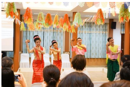
ภาพที่ ๘ นาฏศิลป์สร้างสรรค์ชุดรำมอญร้อนสะบ้า (ที่มา: กษัตริย์เดช เนื่องจางงศ์, ๒๕๖๒)

การประยุกต์ใช้ความรู้เป็นกระบวนการที่นำความรู้ทางวัฒนธรรมไปประยุกต์ให้เกิดประโยชน์ในด้านต่าง ๆ และก่อให้เกิดคุณค่าหรือมูลค่าจากวัฒนธรรมเหล่านั้น อาทิ การนำไปใช้เพื่อการท่องเที่ยว การนำไปใช้เพื่อการแสดง การนำไปใช้เป็นสินค้าหรืออุตสาหกรรมทางวัฒนธรรม เป็นต้น ดังภาพที่ ๘