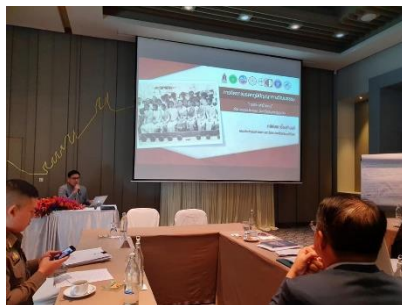
ภาพที่ ๔ การบรรยายเรื่อง การจัดการมรดกภูมิปัญญาทางวัฒนธรรม การเล่นสะบ้าบ่อน อำเภอพระประแดง จังหวัดสมุทรปราการ

การสร้างและแสวงหาความรู้เป็นกระบวนการศึกษา ค้นคว้า รวบรวม และสร้างความรู้ทางวัฒนธรรมทั้งภายในและภายนอกชุมชนมากลั่นกรอง เพื่อสร้างองค์ความรู้และสร้างคุณค่าทางวัฒนธรรมเพื่อเป็นการอนุรักษ์ สืบทอด และสงวนรักษาวัฒนธรรมให้คงอยู่ผ่านรูปแบบต่าง ๆ อาทิ การวิจัย การประชุม การอภิปราย และการสนทนา เป็นต้น ดังภาพที่ ๔