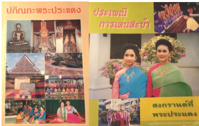
ภาพที่ ๕ หนังสือและเอกสารที่จัดเก็บองค์ความรู้เกี่ยวกับการเล่นสะบ้าบ่อน (ที่มา: กษัตริ์เดช เนื่องจ้งำนงค์, ๒๕๕๘)

การจัดเก็บและเข้าถึงความรู้เป็นกระบวนการจัดเก็บความรู้ในรูปแบบต่าง ๆ อย่างเป็นระบบ โดยอาจจะมีการนำเทคโนโลยีเข้ามาช่วยในการจัดเก็บและเข้าถึงความรู้ทางวัฒนธรรม เพื่อให้เกิดความสะดวกต่อการเข้าถึงข้อมูล และยังใช้เป็นฐานความรู้ที่สำคัญในอนาคต อาทิ หนังสือ เอกสาร แผ่นพับ ภาพถ่าย วิทยทัศน์ เว็บไซต์ และระบบฐานข้อมูล เป็นต้น ดังภาพที่ ๕