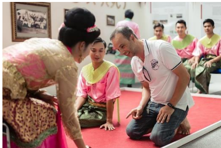
ภาพที่ ๗ การจัดนิทรรศการ และการสาธิตมรดกภูมิปัญญาทางวัฒนธรรมการเล่นสะบ้าบ่อน

การแลกเปลี่ยนความรู้เป็นกระบวนการในการแลกเปลี่ยน แบ่งปัน เผยแพร่ กระจาย ถ่ายโอนข้อมูลความรู้ทางวัฒนธรรมในรูปแบบต่าง ๆ ผู้สารถาณชนผ่านสื่อกระแสหลักและสื่อทางเลือก อาทิ โทรทัศน์ หนังสือพิมพ์ การจัดบรรยาย การสาธิต การจัดนิทรรศการ เป็นต้น ดังภาพที่ ๗