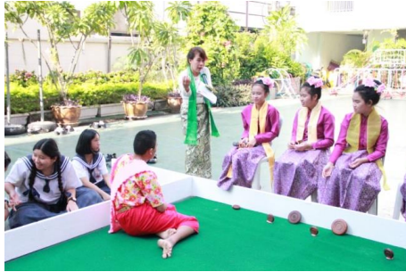
ภาพที่ ๖ การจัดการเรียนการสอนในหลักสูตรท้องถิ่นเรื่องการเล่นสะบ้าบ่อน