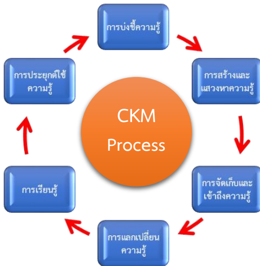
ภาพที่ ๒ กระบวนการจัดการความรู้ทางวัฒนธรรม

กระบวนการจัดการความรู้ทางวัฒนธรรม (Cultural Knowledge Management Process) เป็นการนำเอากระบวนการจัดการองค์ความรู้มาประยุกต์ใช้กับการจัดการทรัพยากรทางวัฒนธรรม เพื่อกลไกอย่างหนึ่งที่ช่วยในการสงวนรักษาองค์ความรู้ทางวัฒนธรรมให้คงอยู่อย่างต่อเนื่อง ซึ่งกระบวนการจัดการความรู้ทางวัฒนธรรมประกอบด้วย ๖ กระบวนการ ได้แก่ การบ่งชี้ความรู้ การสร้างและแสวงหาความรู้ การจัดเก็บและเข้าถึงความรู้ การแลกเปลี่ยนความรู้ การเรียนรู้ และการประยุกต์ใช้ความรู้ ดังภาพที่ ๒