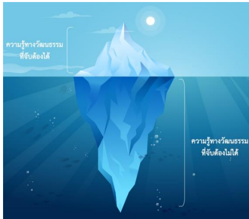
ภาพที่ ๑ สัดส่วนความรู้ระหว่างความรู้ทางวัฒนธรรมที่จับต้องได้ และความรู้ทางวัฒนธรรมที่จับต้องไม่ได้ (ที่มา: กชิตเดช เนื่องจำนงค์, ๒๕๖๓)

Knowledge) หรือผู้สืบทอดวัฒนธรรม หากขาดการสืบทอดความรู้ดังกล่าวก็สูญหายไปเป็นที่สุด นอกจากนี้หากเปรียบเทียบความรู้ทางวัฒนธรรมทั้ง ๒ ประเภทจะพบว่า ความรู้ทางวัฒนธรรมประเภท ความรู้ทางวัฒนธรรมที่จับต้องไม่ได้ (Intangible Cultural Knowledge) มีมากกว่าความรู้ทางวัฒนธรรมที่จับต้องได้ (Tangible Cultural Knowledge) ๘๐ : ๒๐ เปรียบได้เสมือนภูเขาน้ำแข็งในส่วนของโผล่มาเหนือน้ำจะเป็นส่วนที่น้อยมากคิดเป็นร้อยละ ๒๐ หากเทียบกับภูเขาน้ำแข็งในส่วนที่อยู่ใต้น้ำคิดเป็นร้อยละ ๘๐ ดังภาพที่ ๑