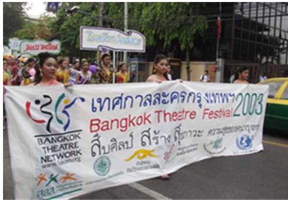
ภาพที่ ๑ ขบวนพาเหรดพิธีเปิด เทศกาลละครกรุงเทพ พ.ศ. ๒๕๔๖ บริเวณถนนพระอาทิตย์

เวลา ๑๓.๐๐ - ๒๒.๐๐ น. เครือข่ายละครกรุงเทพ ร่วมกับชุมชนบางลำพู โดยได้รับการสนับสนุนจากหลายองค์กรดังนี้ สำนักงานกองทุนสนับสนุนการสร้างเสริมสุขภาพ (สสส.) สมาคมไทย - ฝรั่งเศส กรุงเทพฯ (Alliance Francaise Bangkok) องค์กรทุนเพื่อเด็กแห่งสหประชาชาติ (ยูนิเซฟ) สำนักงานศิลปวัฒนธรรมร่วมสมัย สำนักพิมพ์ไยใหม่ จะมีขบวนแห่ โดยกลุ่มคนทำละครทั่วกรุงเทพฯ จากตรอกข้าวสารมาจนถึงถนนพระอาทิตย์ การแสดงเปิดพิธีจากนักร้องละคร และกลุ่มละครต่าง ๆ สำหรับกิจกรรมในงานจะมีการแสดงละครเวทีกลางสวนป้อมสันติชัยปราการ การแสดงในตึกโบราณบนถนนพระอาทิตย์ การแสดงในร้านอาหารบนถนนตลอดสาย มีการสัมมนา และปฏิบัติการเชิงการละคร (Workshop) สำหรับบุคคลทั่วไป โดยมีกิจกรรมที่บริเวณสวนสันติชัยปราการ และสถานที่โดยรอบตลอดถนนพระอาทิตย์ (ภาพที่ ๑) ขบวนพาเหรดพิธีเปิด เทศกาลละครกรุงเทพ พ.ศ. ๒๕๔๖ บริเวณถนนพระอาทิตย์ (ประดิษฐ ประสาททอง, ๒๕๖๑, สัมภาษณ์)