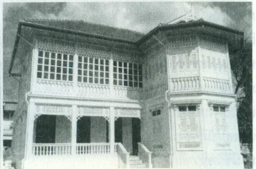
บ้านเอกะนาค