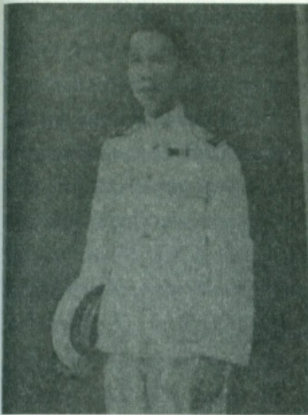
พระยาประสงค์