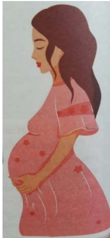
ภาพที่ ๓ ภาพตัวละครหญิงกับกิจกรรมการอบรมเลี้ยงดูบุตร

ภายในหนังสือแบบเรียนชั้นมัธยมศึกษาปีที่ ๓ ปรากฏภาพตัวละครหญิงจำนวน ๒๙๓ ภาพ ซึ่งตัวละครหญิงมีการแต่งกายทั้งแบบกางเกงและกระโปรง และภาพกิจกรรมที่ปรากฏมากที่สุดในพื้นที่สาธารณะของตัวละครหญิงคือ การออกกำลังกาย ลำดับถัดมาคือ การศึกษา การทำงานตามลำดับ และไม่ปรากฏภาพกิจกรรมการพบปะสังสรรค์ สำหรับกิจกรรมที่กระทำในพื้นที่บ้านที่ปรากฏในหนังสือแบบเรียนมากที่สุดของตัวละครหญิงคือ การอบรมเลี้ยงดูบุตร การพักผ่อน และการทำงานบ้านตามลำดับ ดังภาพที่ ๓