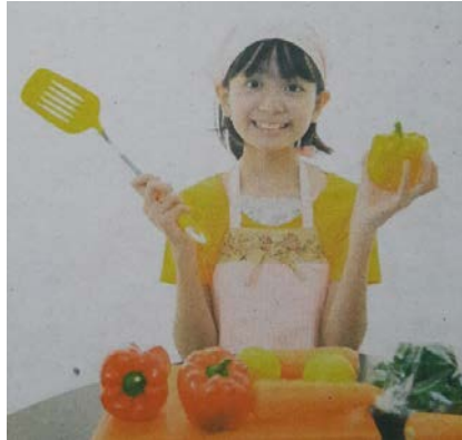
ภาพที่ ๒ ภาพตัวละครหญิงกับกิจกรรมการทำงานบ้านในพื้นที่บ้าน

ภายในหนังสือแบบเรียนชั้นมัธยมศึกษาปีที่ ๒ ปรากฏภาพตัวละครหญิง (ภาพที่ ๒) จำนวน ๒๙๓ ภาพ ซึ่งตัวละครหญิงมีการแต่งกายทั้งแบบกางเกงและกระโปรง และภาพกิจกรรมที่ปรากฏมากที่สุดในพื้นที่สาธารณะของตัวละครหญิงคือ การศึกษา การออกกำลังกาย การทำงานตามลำดับ และไม่ปรากฏภาพกิจกรรมการพบปะสังสรรค์ สำหรับกิจกรรมที่กระทำในพื้นที่บ้านที่ปรากฏในหนังสือแบบเรียนมากที่สุดของตัวละครหญิงคือ การอบรมเลี้ยงดูบุตร การพักผ่อน และการทำงานบ้านตามลำดับ