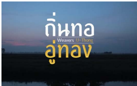
ภาพที่ ๒ ภาพยนตร์สารคดีสั้น เรื่อง “ถิ่นทอ อุ้มทอง”

ตอนที่ ๒ ภาพยนตร์สารคดีสั้น สื่อสารอัตลักษณ์ชุมชนผ่านวัฒนธรรมภูมิปัญญาผ้าทอของกลุ่มชาติพันธุ์ลาว อ่าเภออุ้มทอง จังหวัดสุพรรณบุรี ประกอบด้วย ๓ ชาติพันธุ์ ได้แก่ ไทยทรงดำ ลาวเวียง ลาวครั้ง ผลการศึกษา พบว่า กระบวนการผลิตภาพยนตร์ มี ๓ ขั้นตอน ดังนี้ ขั้นตอนแรกในการเตรียมการก่อนถ่ายภาพยนตร์สารคดีสั้น (Pre - Production) ขั้นตอนที่ ๒ การถ่ายทำภาพยนตร์ (Production) ขั้นตอนที่ ๓ หลังการถ่ายทำ (Post - Production) ผลผลิตได้คือ ภาพยนตร์สารคดีสั้น เรื่อง “ถิ่นทอ อุ้มทอง” เวลา ๑๕ นาที ดังภาพที่ ๒