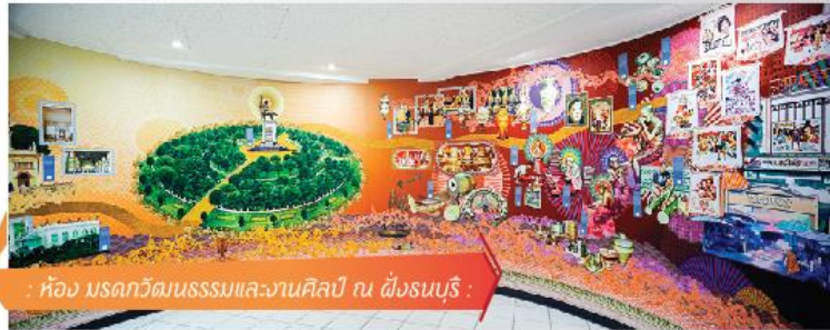
: ห้อง มรดกวัฒนธรรมและงานศิลป์ ณ ฝั่งธนบุรี :

//////ตระกูล "ขุนนาค" ถือเป็นตระกูลแรกๆ ที่เป็นตระกูลปัญญาชนของประเทศไทยในขณะนั้น และมีบุคคลสำคัญที่ต่างได้สร้างคุณูปการต่อประเทศไทยในหลายๆ ด้านไม่ว่าจะเป็นการเมือง การปกครอง การทหาร ความสัมพันธ์ระหว่างประเทศ เศรษฐกิจ สังคม และวัฒนธรรม