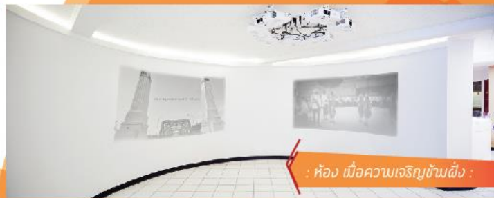
: ห้อง เมื่อความเจริญข้ามฝั่ง :

//////เมื่อกาลเวลาผ่านไป กรุงเทพมหานครเปลี่ยนแปลงรูปโฉมจากพื้นที่ที่เรือสวนไรร่นกลายเป็นชุมชนที่มีความหลากหลายทางเชื้อชาติและวัฒนธรรม ก่อเกิดเป็นพหุสังคมแต่ยังคงความเป็นอัตลักษณ์ของชุมชนชาติพันธุ์ของตนเองได้เป็นอย่างดีเป็นรูปแบบทางวัฒนธรรม ประเพณี นาฏศิลป์ อาหาร งานหัตถกรรม สถาปัตยกรรมที่เป็นเอกลักษณ์ไม่เหมือนที่ใด