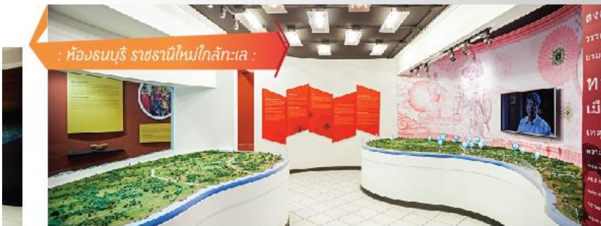
: ห้องธนบุรี ราชธานีใหม่ใกล้ทะเล :

////ททบุรีศรีมหาสมุทร ชื่อเมืองที่พบในทำเนียบหัวเมืองใน สมัยกรุงศรีอยุธยาตอนกลางในรัชสมัยของสมเด็จพระมหาจักรพรรดิ (พ.ศ. ๒๐๙๑-พ.ศ. ๒๑๑๑) ได้ยกฐานะย่านบางกอกขึ้นเป็นเมืองธนบุรี แสดงถึงความสำคัญของกรุงธนบุรีในฐานะเมืองท่าสำคัญ