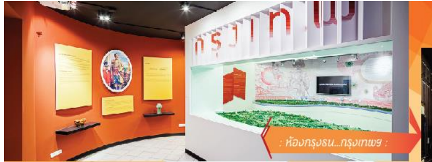
: ห้องกรุงธน...กรุงเทพฯ :

////// แม้จะมีการย้ายราชธานี จากกรุงธนบุรี (ฝั่งธน) ไปยังกรุงรัตนโกสินทร์ (ฝั่งพระนคร) แต่ฝั่งธนฯ ก็ยังคงมีความสำคัญในฐานะที่ประทับของพระบรมวงศานุวงศ์ ขุนนาง ข้าราชการ พ่อค้า ชาวต่างชาติ สะท้อนถึงรากเหง้าของกลุ่มคนที่กลายเป็นส่วนหนึ่งของการพัฒนาบ้านเมืองตั้งแต่อดีตถึงปัจจุบัน