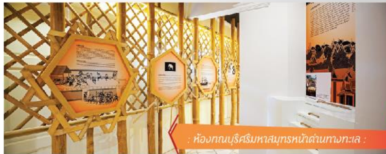
: ห้องททบุรีศรีมหาสมุทรหน้าด่านทางทะเล :

////พื้นที่ดิน ดอนสามเหลี่ยมปากแม่น้ำอันอุดมสมบูรณ์ ก่อเกิด การตั้งชุมชน เกิดย่านต่างๆ ขึ้น มีการขุดคลองเพื่อใช้ในการทำ การเกษตร ค้ายาและคมนาคม เดิมโตจนกลายเป็น "เมืองบางกอก" ที่อุดมไปด้วยเรือกสวนไร่นา และลำคลองน้อยใหญ่ที่เชื่อมโยงเป็น เครือข่ายแบบใยแมงมุม จนถูกขนานนามว่า "เวนิสตะวันออก"