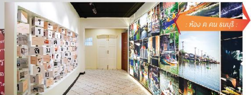
: ห้อง ค คน ธนบุรี :

////// พระปรางค์วัดอรุณฯ สัญลักษณ์แห่งกรุงธนบุรีที่สะท้อนให้เห็นถึงศิลปสถาปัตยกรรมไทยที่สร้างจากหลักคติไตรภูมิที่มีเขาพระสุเมรุเปรียบเสมือนจุดศูนย์กลางของจักรวาล แสดงถึงความเป็จักรพรรดิราชของกษัตริย์ทำให้เกิดความงดงามที่ลงตัวตามแบบสถาปัตยกรรมของกรุงรัตนโกสินทร์