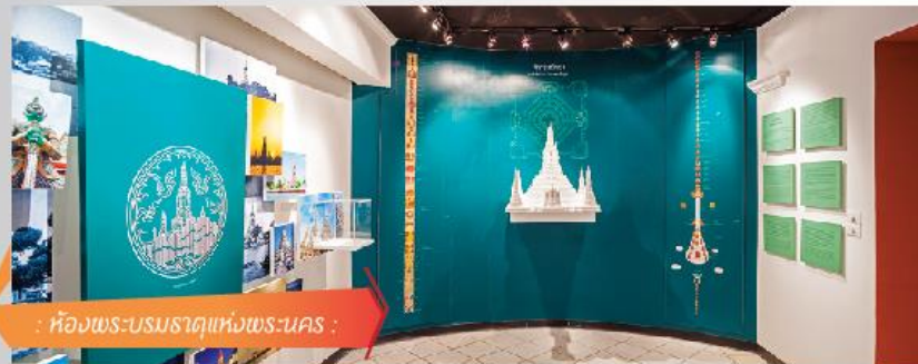
: ห้องพระบรมธาตุแห่งพระนคร :

////// แม้จะมีการย้ายราชธานี จากกรุงธนบุรี (ฝั่งธน) ไปยังกรุงรัตนโกสินทร์ (ฝั่งพระนคร) แต่ฝั่งธนฯ ก็ยังคงมีความสำคัญในฐานะที่ประทับของพระบรมวงศานุวงศ์ ขุนนาง ข้าราชการ พ่อค้า ชาวต่างชาติ สะท้อนถึงรากเหง้าของกลุ่มคนที่กลายเป็นส่วนหนึ่งของการพัฒนาบ้านเมืองตั้งแต่อดีตถึงปัจจุบัน