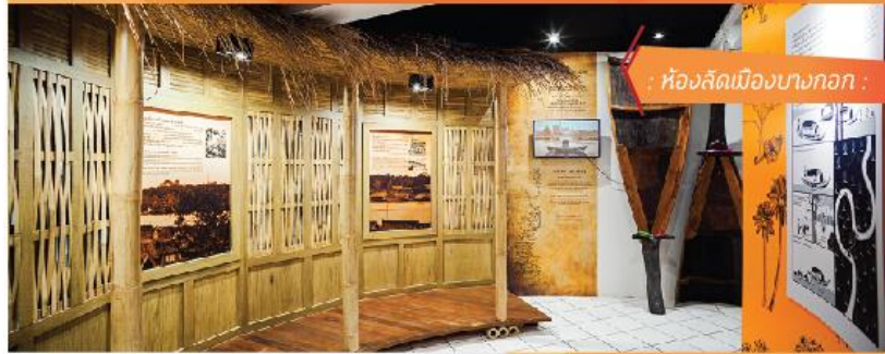
: ห้องลัดเมืองบางกอก :

////พื้นที่ดิน ดอนสามเหลี่ยมปากแม่น้ำอันอุดมสมบูรณ์ ก่อเกิด การตั้งชุมชน เกิดย่านต่างๆ ขึ้น มีการขุดคลองเพื่อใช้ในการทำ การเกษตร ค้ายาและคมนาคม เดิมโตจนกลายเป็น "เมืองบางกอก" ที่อุดมไปด้วยเรือกสวนไร่นา และลำคลองน้อยใหญ่ที่เชื่อมโยงเป็น เครือข่ายแบบใยแมงมุม จนถูกขนานนามว่า "เวนิสตะวันออก"