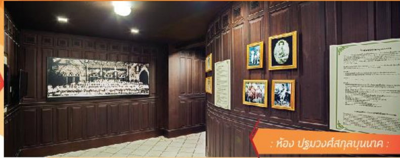
: ห้อง ปฐมวงศ์สกุลขุนนาค :

//////ตระกูล "ขุนนาค" ถือเป็นตระกูลแรกๆ ที่เป็นตระกูลปัญญาชนของประเทศไทยในขณะนั้น และมีบุคคลสำคัญที่ต่างได้สร้างคุณูปการต่อประเทศไทยในหลายๆ ด้านไม่ว่าจะเป็นการเมือง การปกครอง การทหาร ความสัมพันธ์ระหว่างประเทศ เศรษฐกิจ สังคม และวัฒนธรรม